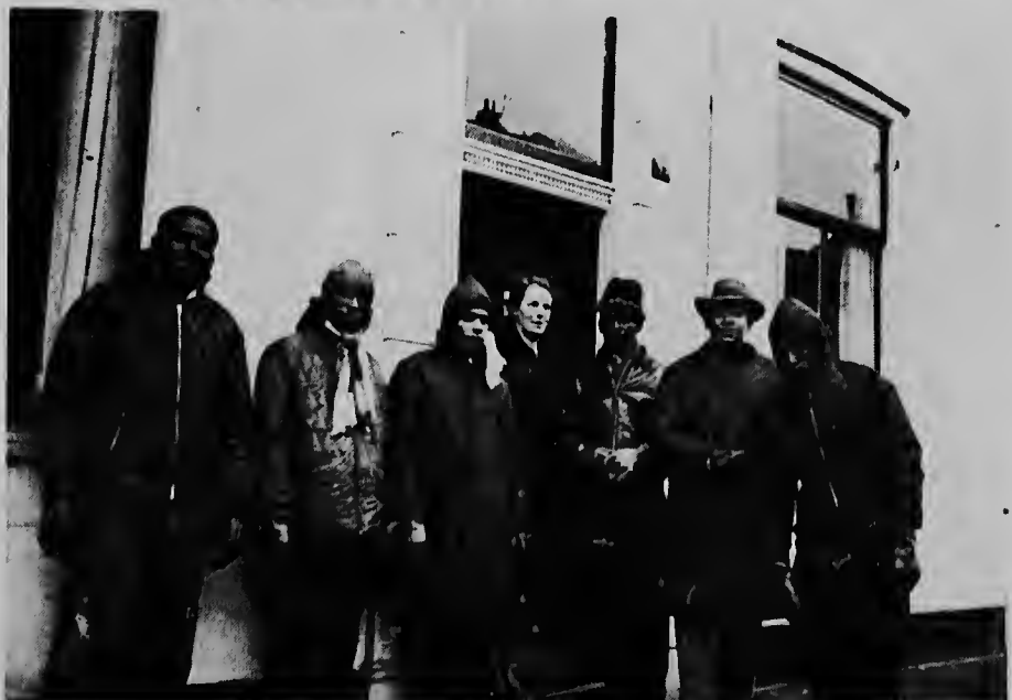
Presentacion cu nan hospita tabata satisfactorio.